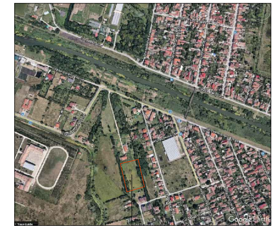
ZONA AFERENTA P. U. Z. LOCUINTE SI FUNCTIUNI OMPLEMENTARE Parcela C.F.nr.433108 Timisoara, Jud. Timis